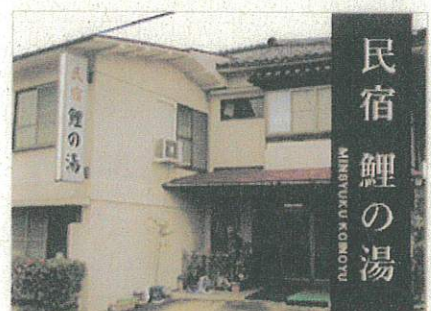
民宿鯉の湯 MINSHUKU URA NO YU