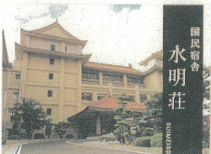
国民宿舎 水明荘 SUIMINSHU SUIMEI