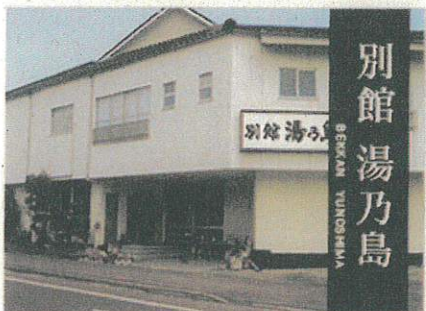
別館湯乃島 RYOKAN TAMONAJIMA