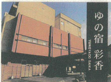
ゆの宿 彩香 YUME NO SHUKUEI

湯梨浜町では、新型コロナウイルス感染症の影響により3年ぶりの開催となる第44回大会参加者のみなさまに感謝の意を込めまして、大会事務局を經由して「はわい温泉」「東郷温泉」に宿泊される場合、宿泊助成キャンペーンとして1泊につき2,000円の助成を実施します。