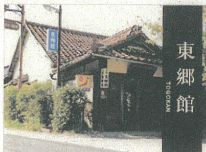
東郷館 TOONAKA RYOKAN